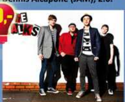
The Talks (UK), 25.6.

FEUERWERKS OPEN-AIR Die große Party am Rhein zum Feuerwerk der Mainzer Johannisnacht Live dabei: The Talks (UK), The G-Men (UK), King Hammond (UK) backed by the Saloon Soldiers. Hingehen - feiern! (s.a. Vorderseite)