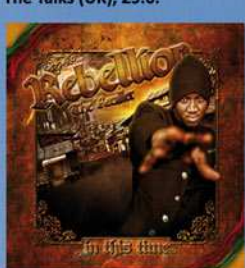
REBELLION - the recaller, 30.6.

REGGAE OPEN AIR Auch in diesem Jahr wartet das Rheinufer Reggae Open-Air wieder mit vollem Programm auf. Unter anderem sind dabei: - Rebellion - the recaller - Ras Zaza - Goldi ... und viele mehr! Veranstalter: Ostafrika AG der Uni Mainz in Kooperation mit dem Kinder- und Jugendzentrum AKK in der Reduit.