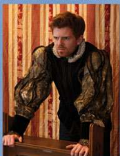
ZETTELS THEATER, 24.8.

ERÖFFNUNG der 15. AKK Kulturtage im Zelt auf dem Messerschmittgelände ZETTELS THEATER "Richard der III. - Ein Requiem für die Krone" Shakespeare - diesmal im Zelt auf dem Messerschmittgelände England 1471. Richard Plantagenet, Herzog von Gloster, beschreitet seinen Weg zur Macht. Ein Unheilsbringer in der Not. Brudermörder, Königsmörder, Usurpator. Ein Mathematiker des Todes. ZETTEL'S - THEATER hüllt die Sommerabende in schwarze Witwenschleier, taucht die Nacht blutrot in Ohnmacht und Verzweiflung. Ein Schauspiel von der Faszination des Bösen. Wir wünschen dennoch viel Vergnügen ... (in Kooperation mit dem Kinder- und Jugendzentrum in der Reduit)